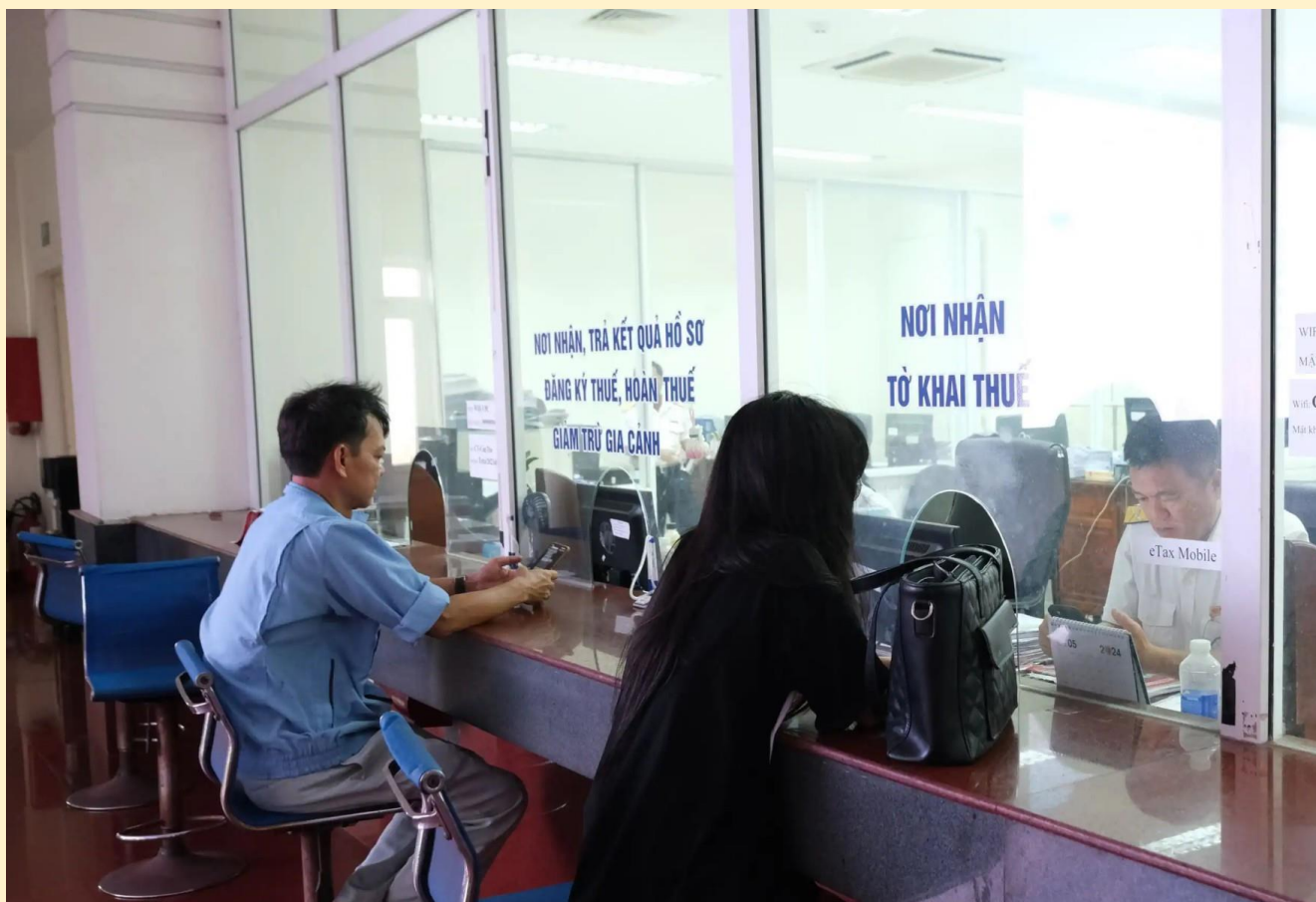
Người nộp thuế thực hiện thủ tục tại Cục Thuế TP Cần Thơ.