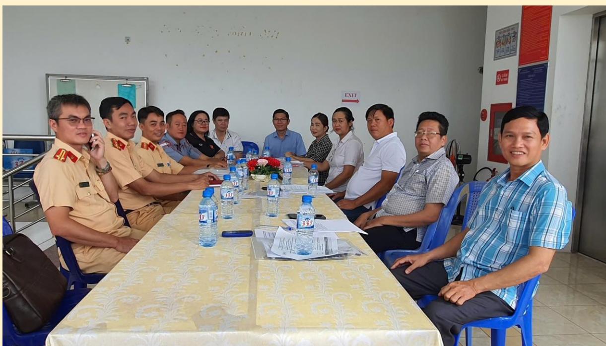
Tổ Thư ký tiếp nhận câu hỏi của khán giả qua Đường dây nóng

Với thời lượng 60 phút, các diễn giả đã trao đổi và giải đáp trực tiếp những khó khăn, vướng mắc của người dân trong quá trình thực hiện các Thủ tục hành chính trong lĩnh vực cấp đổi giấy phép lái xe, đăng kiểm xe và xử lý vi phạm