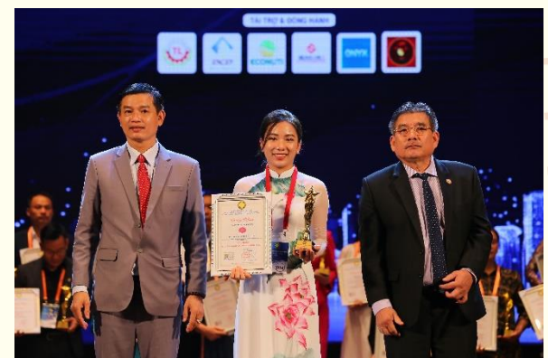
Đại diện một trong những doanh nghiệp được biểu dương