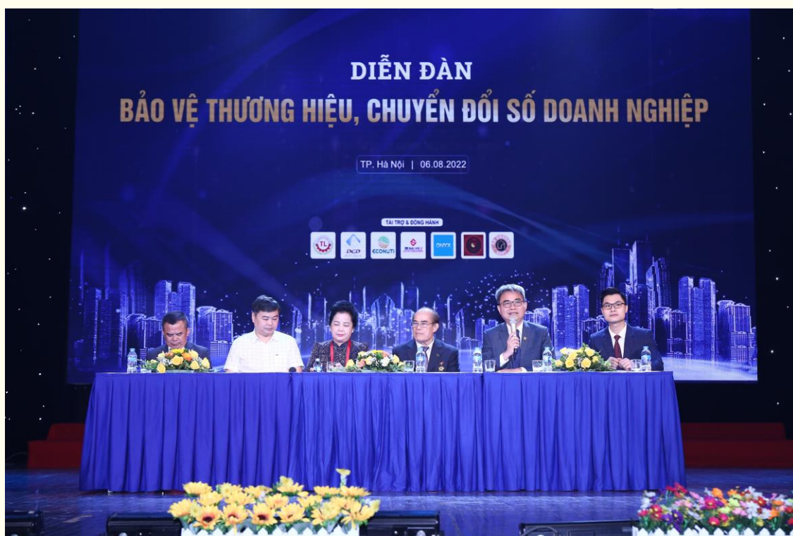
Ông Đinh Hữu Phú – Cục trưởng Cục sở hữu trí tuệ phát biểu tại diễn đàn

Chương trình diễn đàn nhằm tuyên truyền nâng cao nhận thức và hỗ trợ tổ chức quyền sở hữu trí tuệ cho các kết quả nghiên cứu khoa học và đổi mới sáng tạo, nâng cao chất lượng và năng lực cạnh tranh của các sản phẩm quốc gia, sản phẩm chủ lực quốc gia, sản phẩm, dịch vụ chủ lực, đặc thù cấp tỉnh, thành phố trực thuộc trung ương và sản phẩm gắn với Chương trình OCOP được hỗ trợ đăng ký tổ chức, quản lý và phát triển tài sản trí tuệ, kiểm soát nguồn gốc và chất lượng. Biểu dương, khen thưởng tập thể, cá nhân có thành tích trong hoạt động sở hữu trí tuệ, nâng tỷ trọng, năng suất, chất lượng, hiệu quả và sức cạnh tranh của nền kinh tế.