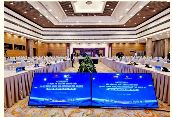
Toàn cảnh diễn đàn